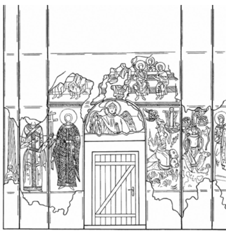
Јужни зид њријраше Велуће, њрема Ж. Андрејићу