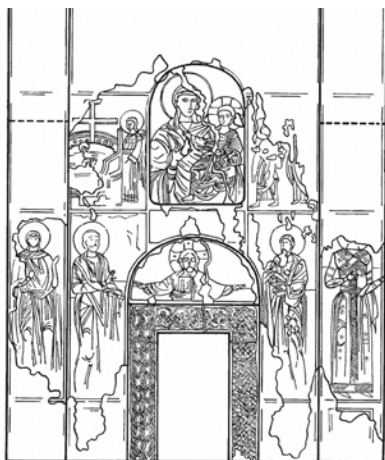
Источни зид њријраше Велуће, њрема Ж. Андрејићу