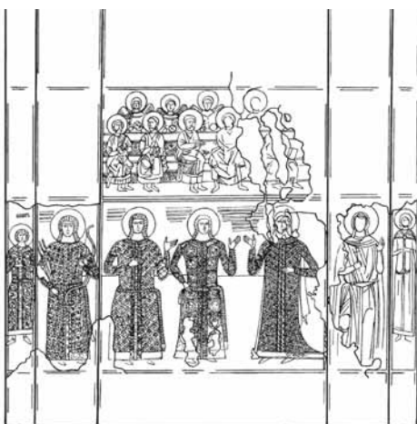
Северни зид њријраше Велуће, њрема Ж. Андрејићу